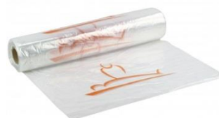
Artikel Nr: 125010 Schutzhülle